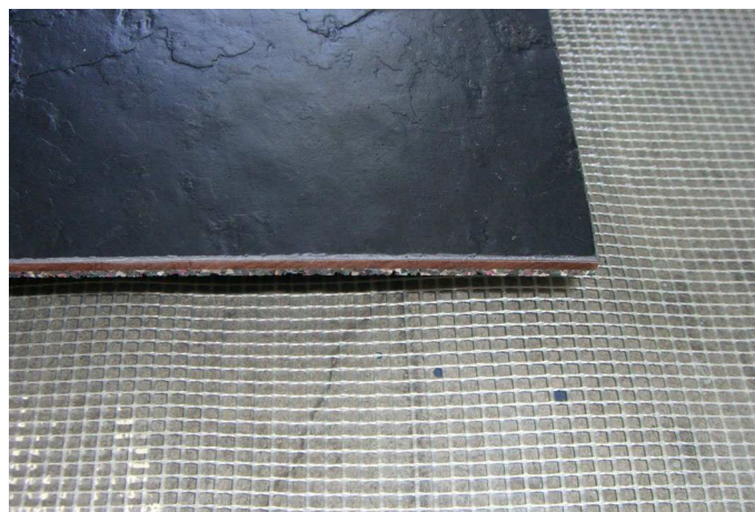
Abb.: Stone-Veneer® Verlegegitter (Detail)